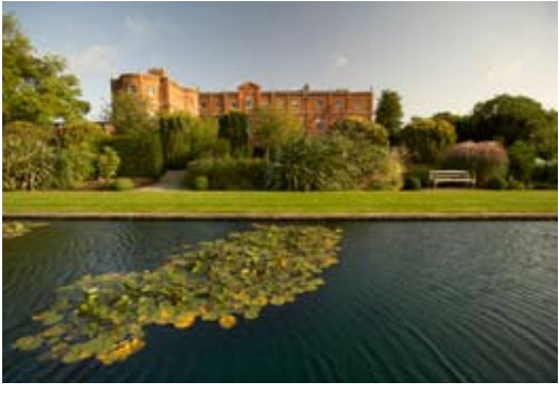
小树林酒店始建于1996年, 是一家典型的乡村别墅。